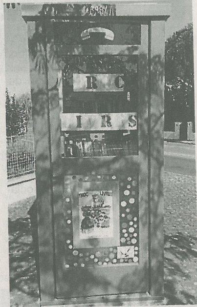
La bibliothèque de rue des Landes d'Apigné va bientôt ouvrir sa porte.

« Chaque dernier week-end de novembre, les Banques alimentaires sollicitent le grand public pour leur collecte nationale. Nous recherchons donc des bénévoles, pour des créneaux de deux heures pour le dernier week-end de novembre. »